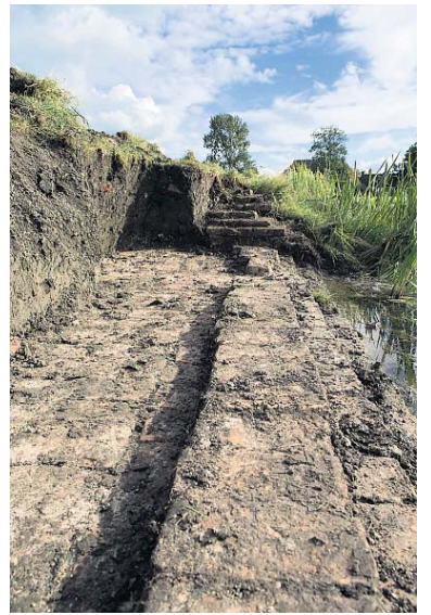
Het fundament van de Boogpoort naar het Thetingaterrein.