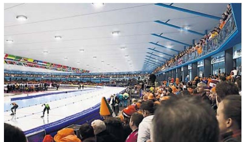
Een eerder gepresenteerde artist impression van de hal in Almere.